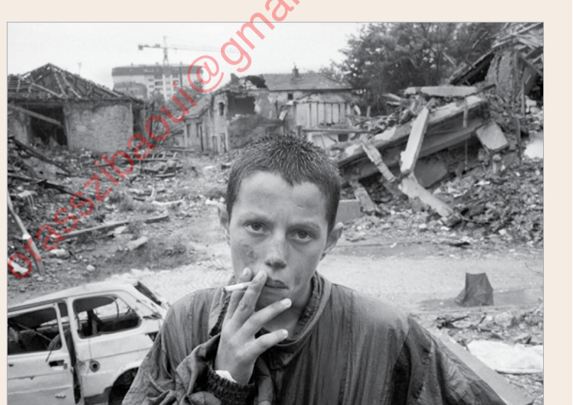
دمار حرب كوسوفو، 1999.

مع المصورين الصحفيين الكبار لا تعود أهمية الصورة الفوتوغرافية تتمثل في بعدها التوثيقي للحادث، بل في رؤيتها الخاصة التي تجعل منها عملاً فنياً. في هذا السياق، ضمن سلسلة من الكتب المصورة التي تصدرها منظمة "مراسلون بلا حدود"، المخصصة لكبار مصوري الصحافة في العالم، صدر كتاب جديد بعنوان "عباس، مئة صورة من أجل حرية الصحافة" يضم مئة صورة أنجزها المصور الإيراني العالمي الراحل عباس عطار (1944-2018) الذي كانت صورته الملتقطة في مختلف أنحاء العالم شاهداً على العصر. إنها المرة الأولى تجمع فيها عينة من هذه الصور بالأبيض والأسود في كتاب واحد، يضم أيضاً شهادات لشخصيات 10