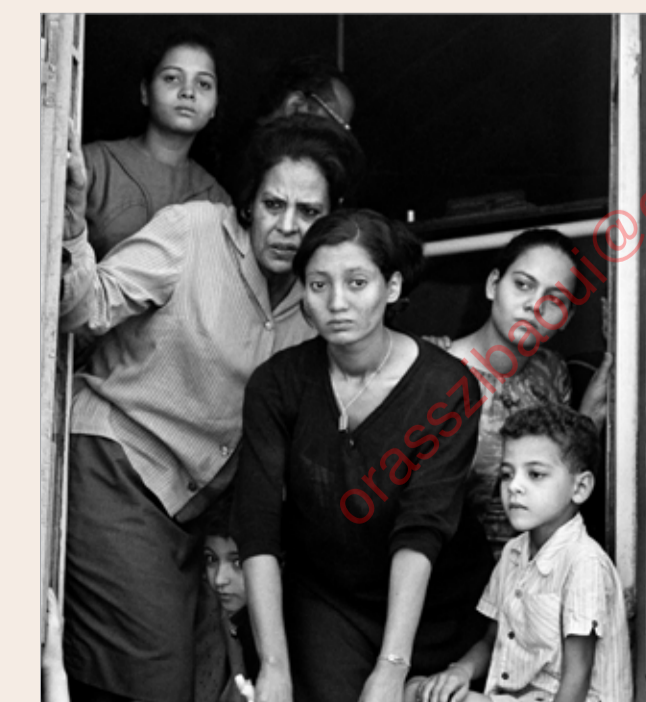
عائلة مصرية تبكي الرئيس جمال عبد الناصر، القاهرة 1970.

آلاف الجنود في شمال سوريا، ما حال دون استعادة الجيش السوري المدعوم من روسيا السيطرة على المنطقة. وقال الأسد الذي زار موسكو وأجرى محادثات مع الرئيس الروسي فلاديمير