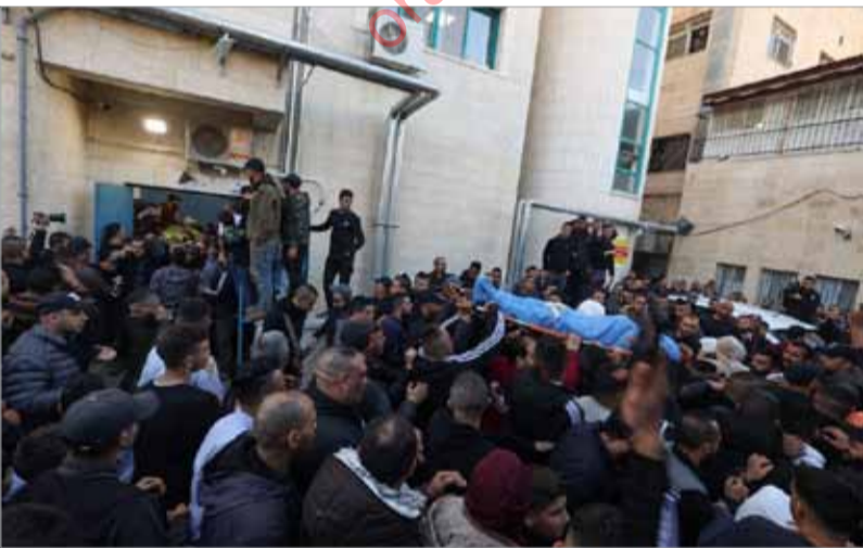
فلسطينيون يشيعون ضحايا الهجوم الإسرائيلي على جنين بالضفة الغربية أمس.

منعها تحمل في طياتها ضراً كبيراً". وأضاف أن عملية "مجدو مركبة ومعقدة وذات خيوط عديدة"، قائلًا إن "إسرائيل ستصل إلى كامل تفاصيلها". وقال إن "المسؤولين عن تنفيذ عملية مجدو سيندمون على ذلك، وإن إسرائيل ستجد المكان والطريقة المناسبين لتوجيه ضربة لهم".