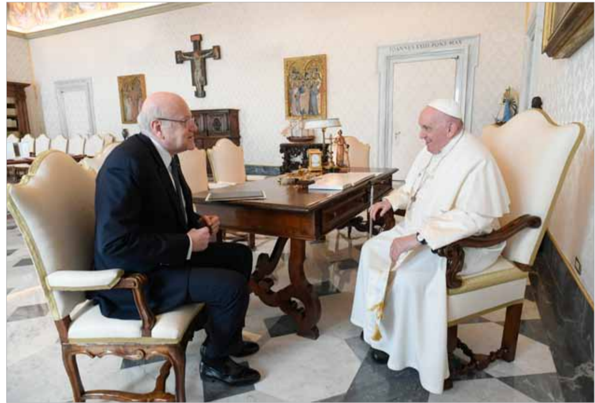
الابا فرنسيس يستقبل في الفاتيكان رئيس حكومة تصريف الاعمال نجيب ميقاتي. وفي الصورة الثانية (حسام شبارة) اجراءات امنية عند بوابة قصر العدل قبيل وصول الحاكم رياض سلامة للتحقيق معه.

الأمين العام لعمليات حفظ السلام جان بيار لاکروا إحاطة الى مجلس الأمن حول تنفيذ القرار 1701 (2006)، واعربت فرونتسكا عن القلق البالغ بشأن عدم إحراز تقدم نحو انتخاب رئيس جديد للجمهورية منذ الإحاطة الأخيرة في تشرين الثاني الماضي وشددت على ضرورة إبداء القادة 10