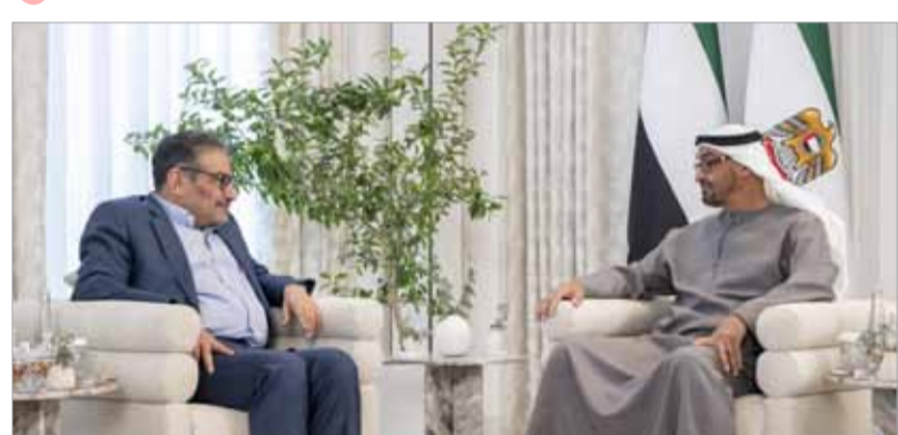
الرئيس الإماراتي الشيخ محمد بن زايد آل نهيان وأمين المجلس الأعلى للأمن القومي الإيراني علي شمخاني في أبو ظبي أمس.

وأضافت: "كما بحث الجانبان القضايا والمستجدات الإقليمية والدولية محل الاهتمام المشترك، وأهمية العمل على دعم السلام والتعاون في المنطقة بما يحقق تطورات شعوبها للتنمية والازدهار".